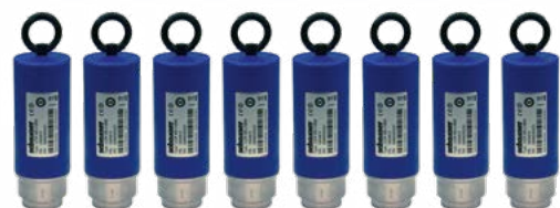
Offline-Messung mit bis zu 8 Multisensoren